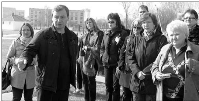
Prezentarea rutei turistice în Zona Ramsar

Din aprilie curent, obiectivele turistice din regiunea transnistreană, în special din Zona Ramsar „Nistrul de Jos”, sunt mai accesibile pentru turiști. După o pauză de 18 ani, a fost inițiată colaborarea între agențiile de turism de pe ambele maluri ale Nistrului, în vederea dezvoltării afacerilor în domeniu în această regiune, iar turiștii au posibilitatea să descopere locuri noi, cum ar fi obiectivele istorice din orașul