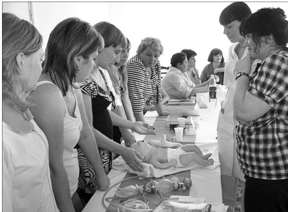
La unul din cursurile de instruire

„Din cele observate, situația în maternități este similară cu cea de acum zece ani din maternitățile din Moldova. De exemplu, la noi, mama se spitalizează în salonul „travaliu-naștere-recuperare” unde se află în perioada travaliului, a nașterii și două ore după naștere sau „travaliu-naștere-recuperare-